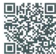
QR Code ที่ตั้งหน่วย

หมายเหตุ : ค่าใช้จ่ายที่ต้องเตรียมในการรับรายงานตัว ค่าใช้จ่ายเพื่อจัดซื้อ/วัสดุ/อุปกรณ์ ที่ใช้ในการฝึกและอื่นๆ อาจเปลี่ยนแปลงได้ตามความเหมาะสมตามรายการ