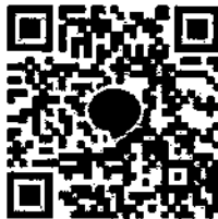
QR Code กลุ่มไลน์ “นสต.18 ศฝร.ภ.8”