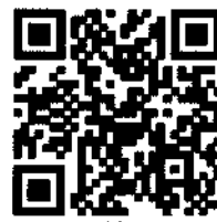
QR Code กรอกข้อมูลอุปกรณ์เครื่องแต่งกาย